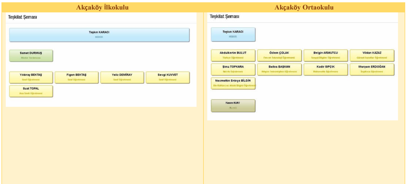
Tablo 10. Teşkilat Şeması